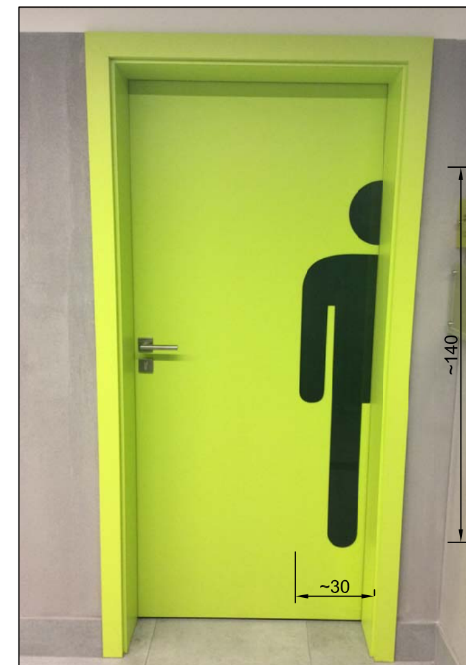
GRAFIKA/PIKTOGRAM WYKONANY NA SKRZYDLE - WZÓR: "TOALETA MĘSKA"

PIKTOGRAMY NA DRZWIACH POMIESZCZEŃ SANITARNYCH (WSKAZANE W UWAGACH INDYWIDUALNYCH DANYCH DRZWI)