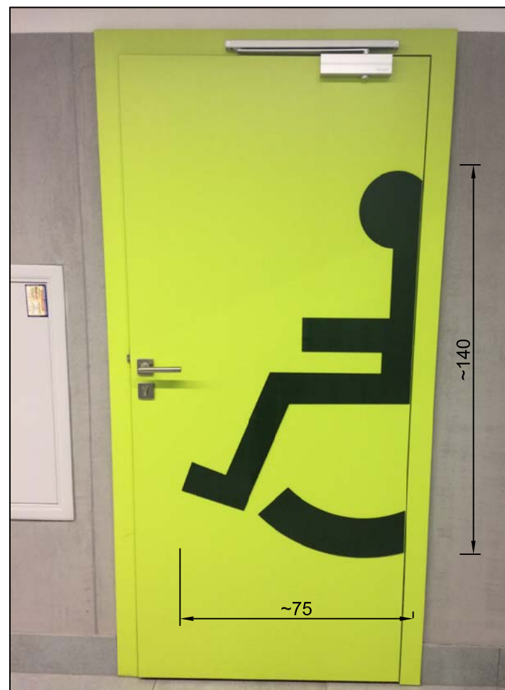
GRAFIKA/PIKTOGRAM WYKONANY NA SKRZYDLE - WZÓR: "TOALETA DLA OSÓB NIEPEŁNOSPRAWNYCH"