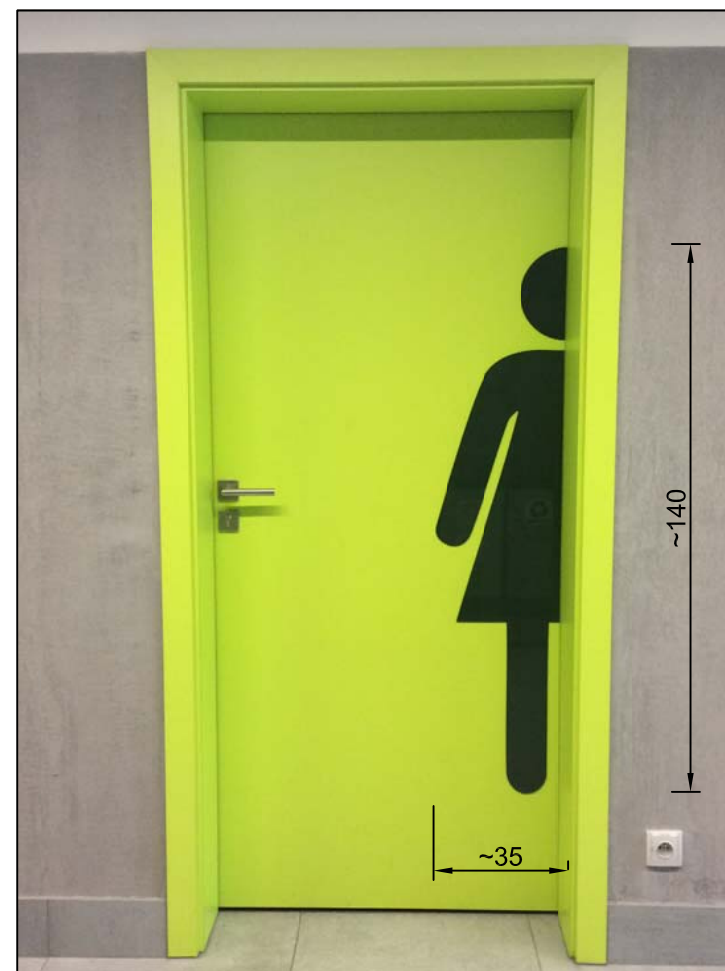
GRAFIKA/PIKTOGRAM WYKONANY NA SKRZYDLE - WZÓR: "TOALETA DAMSKA"